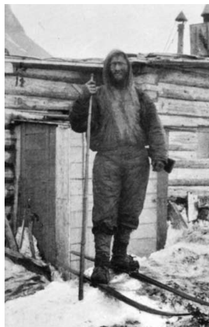
Mitte: Fridtjof Nansen. Außen: Nansen und Johansen auf Franz-Josef-Land im August 1896, Foto: library of congress