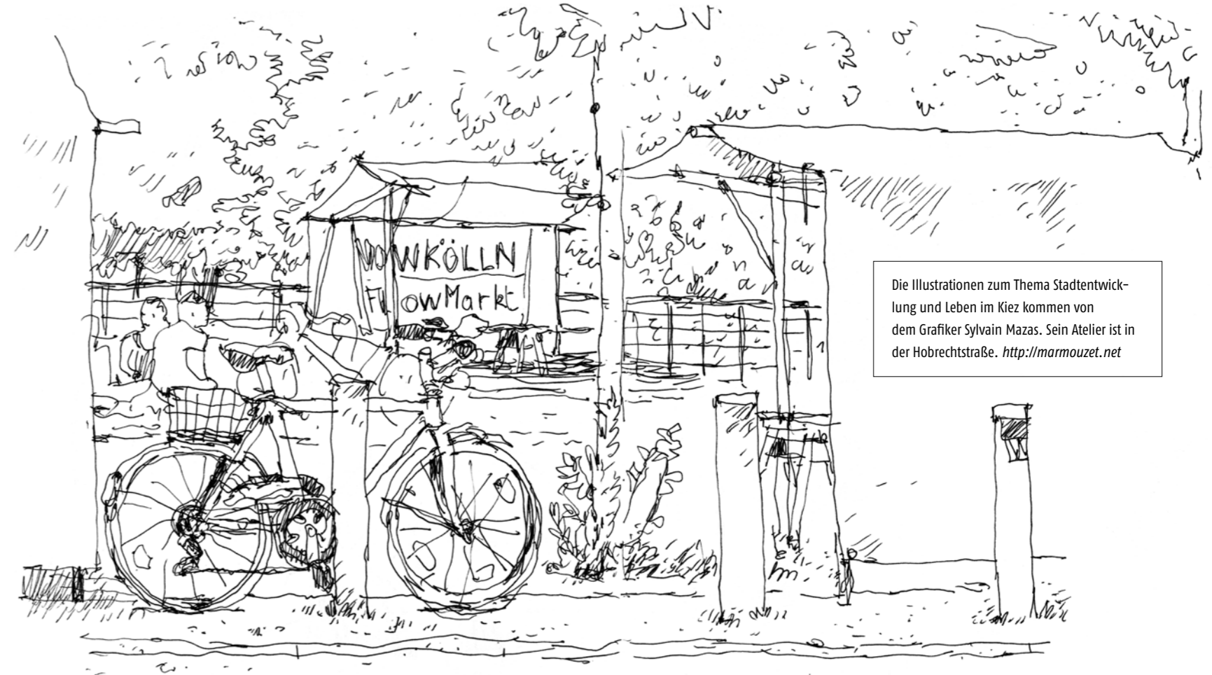
Die Illustrationen zum Thema Stadtentwicklung und Leben im Kiez kommen von dem Grafiker Sylvain Mazas. Sein Atelier ist in der Hobrechtstraße. http://marmouzet.net

Gefördert durch die EU, die BRD und das Land Berlin im Rahmen des Programms »Zukunftsinitiative Stadtteil« Teilprogramm »Soziale Stadt« - Investition in Ihre Zukunft!