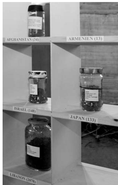
Erde aus Israel, Erde aus Japan... Die Erde ist eben unteilbar.