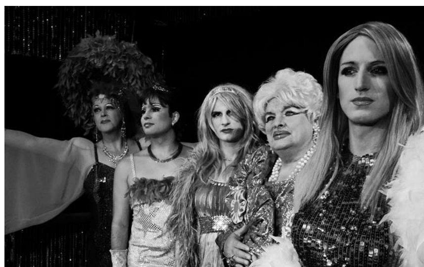
Wie schön sie sind: Diaries, die neue Show im TIK