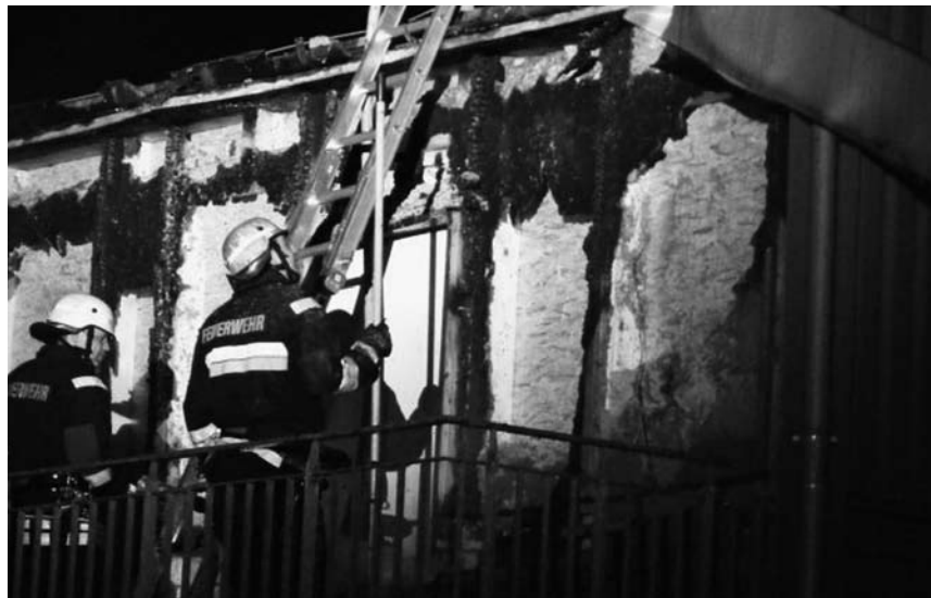
Nach dem Brandanschlag auf das Kinder- und Jugendzentrum, Anton-Schmaus Haus, Foto: Indymedia

Am 11. September, dem Aktionstag gegen Rassismus, Neonazismus und Krieg, wird das Bündnis Neukölln auch mit einem Stand vertreten sein, von 13 bis 18 Uhr am Lustgarten zwischen Dom und Altem Museum. www.buendnis-neukoelln.de