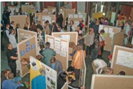
Informationen und die Gelegenheit zum Aufbau von Netzwerken bot die Projektmesse beim Stipendiatentag 2005

Der Erfolg eines Projekts hängt auch von seinem öffentlichen Auftritt ab. Beschreiben Sie in diesem Abschnitt die Kommunikation mit den Betroffenen, den Förderern Ihres Projekts und Ihren Mitarbeitern! Wenn Sie bereits über Informationsmaterial verfügen, fügen Sie dieses bei! Empfohlener Umfang: 1/2 Seite (gegebenenfalls plus Zeitungsartikel, Prospekt o.Ä.)