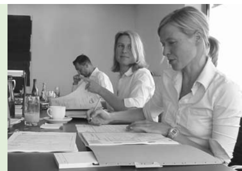
Jurymitglieder bei der Sichtung der eingereichten Projektkonzepte der Bewerber