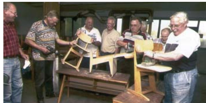
Eine Betriebsgruppe der AGE beim Anfertigen von Möbeln für ein Kinder-/Jugendtheater