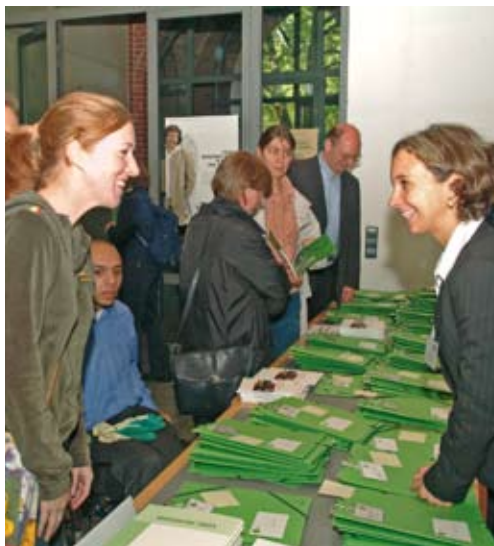
Teilnehmer von startsocial beim Stipendiatentag in Berlin

Das vorbereitete Formular auf dem Bewerbungsbogen soll Ihnen die Dokumentierung der Einnahmen- und Ausgabenplanung erleichtern. Für Ihre Bewerbung bei startsocial reicht eine quartalsweise Planung des ersten Jahres aus. Selbstverständlich können Sie zusätzlich detaillierte Planungen bzw. Planungen über einen längeren Zeitraum oder verschiedene Szenarien (z.B. als Excel-Tabelle) einreichen, sofern Sie darüber verfügen. Gehen Sie in zwei Schritten vor: