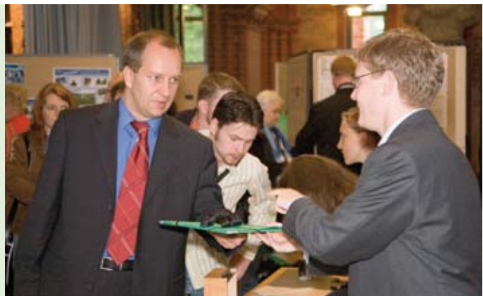
Teilnehmer des Stipendientags 2006