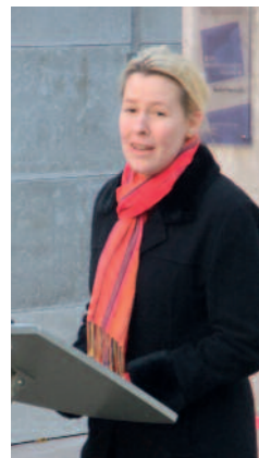
Bezirksstadträtin für Bildung, Schule, Kultur und Sport Frau Dr. Giffey

Die „Temporäre Garage“ wurde am 29. und 30. Oktober 2010 von 10 Schüler/innen unserer Schule zusammen mit 10 Mitarbeiter/innen und Mitarbeitern von Stiftungen* und Unternehmen* errichtet und am 30. Oktober um 13 Uhr eingeweiht. Ganz im Sinne des Campus arbeiteten der Bezirk Neukölln, private Sponsoren, die Wirtschaft und die Schule Hand in Hand zum Wohle eines verbesserten Bildungsangebotes für die Schüler/innen.